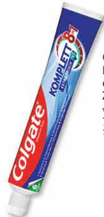
Colgate Komplett extra frisch Zahncreme versch. Sorten 75 ml 1 l = 13,20