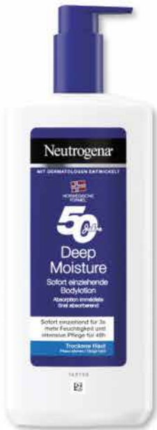
Neutrogena Körperlotion versch. Sorten 400 ml 1 l = 9,98