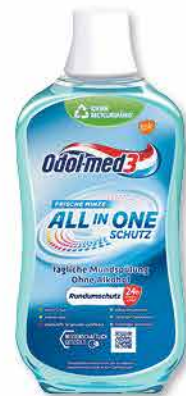
Odol-med3 Mundspülung versch. Sorten 500 ml 1 l = 4,90