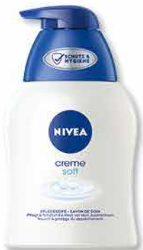
Nivea Flüssigseife versch. Sorten 250 ml 1 l = 6,36