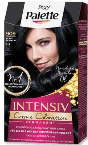
Poly Palette Intensiv Creme Coloration versch. Farben Packung