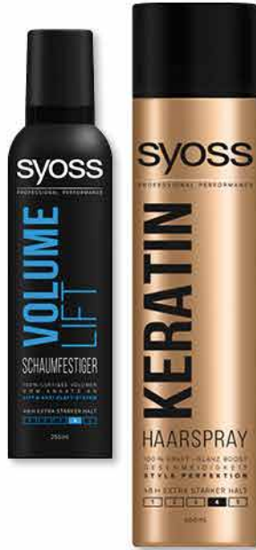
Syoss Haarspray oder Schaumfestiger versch. Sorten vegan 400/250 ml 1 l = 9,98/15,96